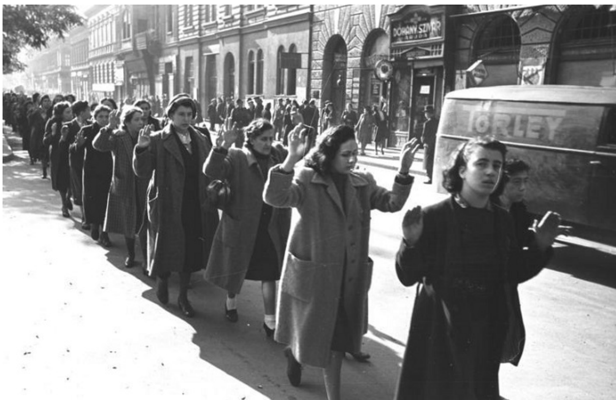
Еврейские женщины, арестованные в Будапеште, 1944