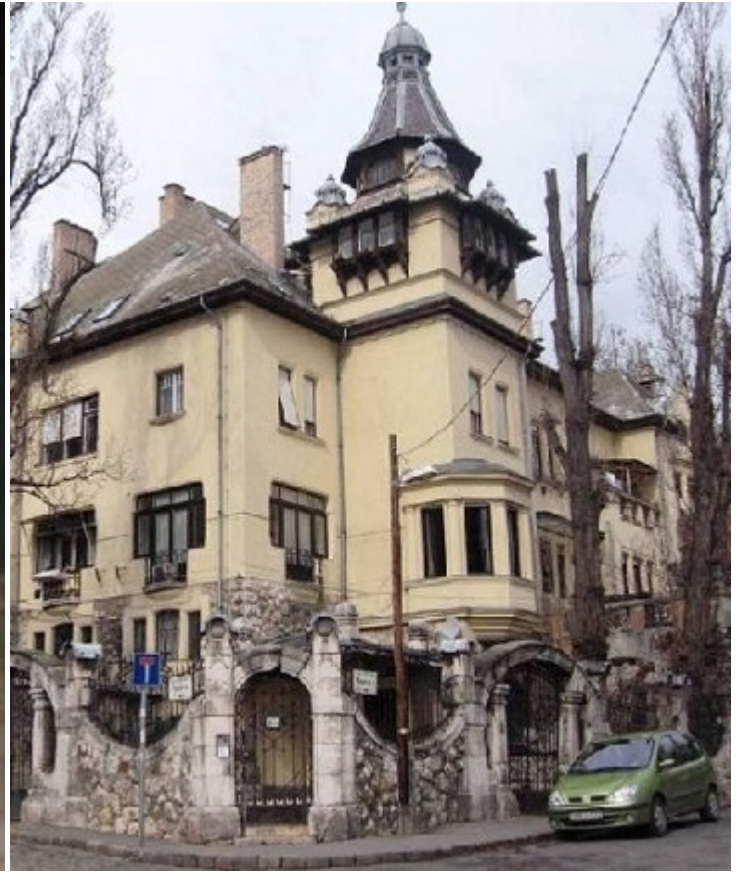
Здание шведской миссии, откуда Валленберг управлял операцией по спасению евреев.